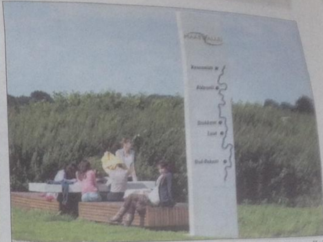
Elementen van de huisstijl die ook langs de Maas in Nederlands-Limburg verschijnen: (v.l.n.r.) fietsenstalling, informatiebord en zitbank met locatiebord.